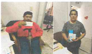
ENTREGA DE MEDICAMENTO