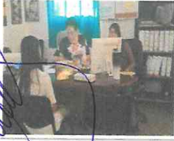
Unidad de primer contacto