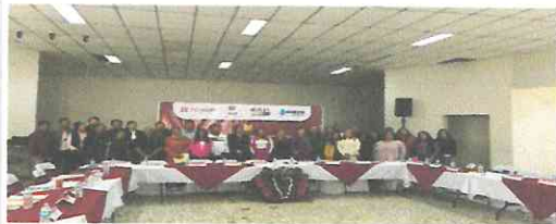
Instalación del Sistema Municipal para Prevenir, Atender, Sancionar y Erradicar la Violencia en contra de las Mujeres y de Igualdad entre Mujeres y Hombres