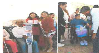
ENTREGA DE APARATOS PARA LA MOVILIDAD